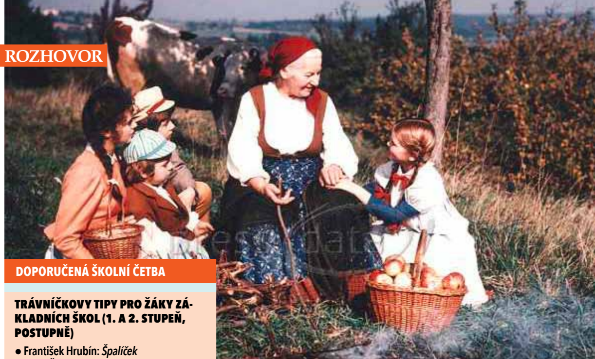
Babičku od Boženy Němcové by literární vědec Jiří Trávniček předložil studentům až na střední škole. Ve filmu z roku 1971 hlavní postavu ztvárnila Jarmila Kurandová.