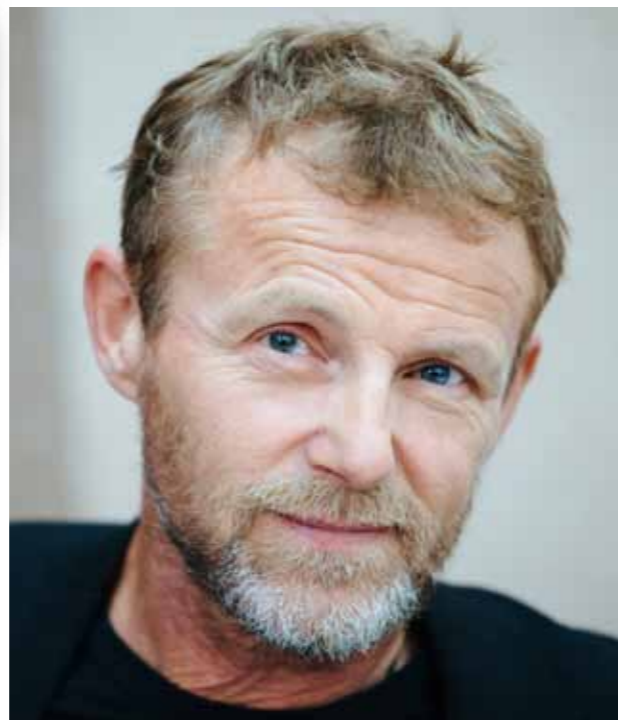
Norská kometa Jo Nesbø, představitel skandinávské krimi. I čeští čtenáři si oblíbili jeho komisaře Harryho Holea, který mimo jiné bojuje i s alkoholem.